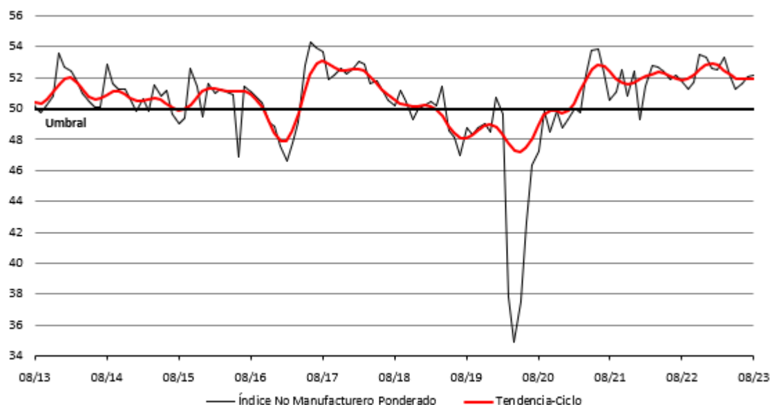
Cuadro 2: Indicador IMEF No Manufacturero y sus componentes