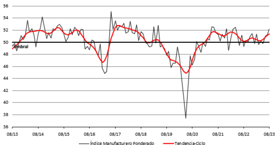
Cuadro 1: Indicador IMEF Manufacturero y sus componentes