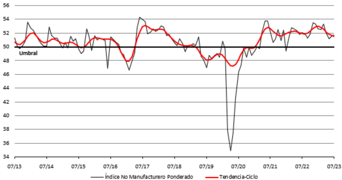
Gráfica 3: Indicador IMEF No Manufacturero y su tendencia-ciclo

Al interior, el componente de Nuevos Pedidos aumentó 0.4 puntos , cerrando en 52.8 unidades . Producción aumentó 1.8 puntos (en 53.3) , Empleo cayó (-)0.5 puntos (quedando en 50.6) , y Entrega de Productos bajó (-)0.2 puntos (ubicándose en 50.7) . Se destaca que, todos los componentes del Indicador IMEF No Manufacturero se sitúan en nivel de expansión (>50), y registran varios meses en este nivel. No obstante, la tendencia de los últimos meses sugiere un ritmo de crecimiento menos dinámico.